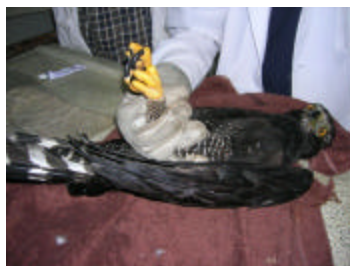
Contención de Spizaetus tyrannus en un centro de rehabilitación

El traumatismo es la razón más común por la que las aves rapaces han sido presentadas para tratamiento en la URRAS de la Universidad Nacional de Colombia. El trauma cefálico se observa frecuentemente en rapaces, y las secuelas neurológicas pueden deteriorar su total recuperación funcional. Además, el trauma ocular puede conducir a laceración de la córnea, proptosis lenticular, y desprendimiento parcial o total de retina, y el gran tamaño de los ojos, en comparación con el tamaño proporcional de su cráneo, predispone a las rapaces a trauma y hemorragia intraocular. En consecuencia, la visión, difícil de evaluar, compromete la recuperación del animal. Las fracturas de los huesos largos son también de común ocurrencia. Las técnicas para su reparación están ampliamente descritas, pero una apropiada valoración (radiografías adecuadas y oportunas) y una pronta intervención quirúrgica incrementan el éxito en la reparación. Tanto la fijación externa, como la combinación de las técnicas de fijación externa e interna, son efectivas. Finalmente, el periodo postoperatorio debe incluir un programa de