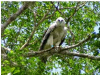
Águila Arpía liberada en Río Bravo, Belice