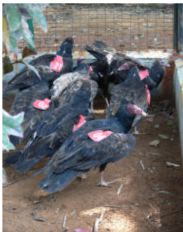
Grupo de buitres