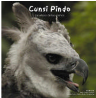
Cubierta de “Cunsi Pindo: la señora de los monos”

Éste trabaja sobre el enfoque de biología de la conservación, y no tanto sobre “preservación de los recursos naturales”, un concepto más estático en donde la idea es no intervenir con el ecosistema. En nuestras áreas de acción existen poblaciones humanas, y hay que considerarlas. En una estrategia de conservación, en donde existe un manejo activo de los recursos de manera que éstos se puedan perpetuar, se deben tener en cuenta los aspectos culturales, sociales y económicos además de los biológicos y geográficos, así como involucrar a las