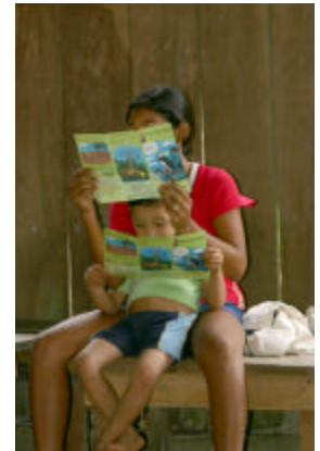
Dos niños en una comunidad rural en Darién, leyendo los materiales educativos sobre rapaces

Para continuar expandiendo el mensaje de conservación de las Águilas Arpías y las rapaces en general a un nivel nacional, el NEEP ha elaborado una Guía Didáctica para maestros de educación básica, titulada Las Aves Rapaces . La guía con-