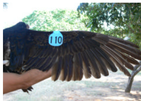
Marcador azul en ala derecha

Estos reportes ayudaran a los científicos del Hawk Mountain Sanctuary a determinar la época y la geografía de la migración de la especie, así como los sitios ocasionales de anidación de las aves. Algunos gallinazos llevan marcadores rojos con números blancos, otros tienen marcadores azules con números negros. Se dispone de un afiche de "SE BUSCA", que se encuentra en el sitio de Internet de Hawk Mountain Sanctuary y como PDF a través de Keith Bildstein. Si ves un Gallinazo Cabecirrojo con un ala marcada, por favor reporta la fecha y sitio específico de tu avistamiento, así como el color del marcador, el número, el