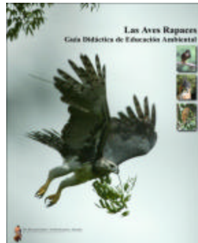
Cubierta de “Las Aves Rapaces”

El Programa Neotropical de Educación Ambiental (NEEP) del Fondo Peregrino-Panamá llega a tres áreas claves en Panamá: 16 comunidades alrededor de Parque Nacional Soberanía (PNS) en donde estamos liberando Águilas Arpías jóvenes; 21 comunidades en Darién, al este de Panamá, donde todavía existe una población silvestre de Arpías, y, recientemente, se incorporamos 13 comunidades en la región de